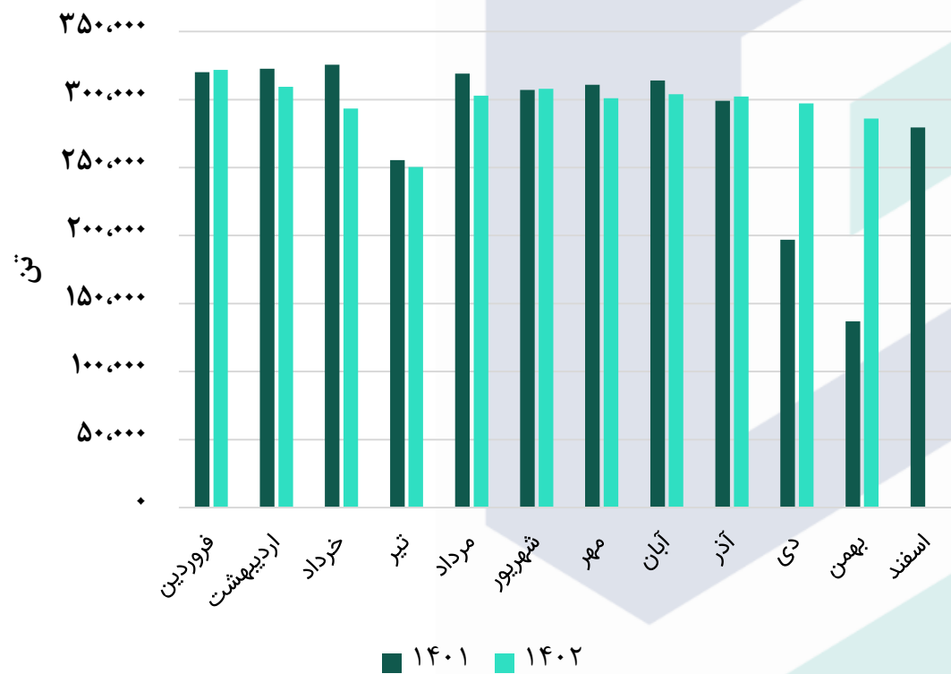
روند مقداری تولید