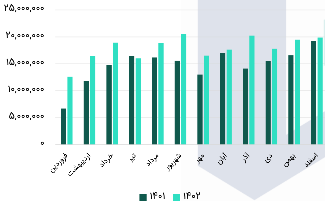
روند مبلغ فروش محصولات (میلیون ریال)