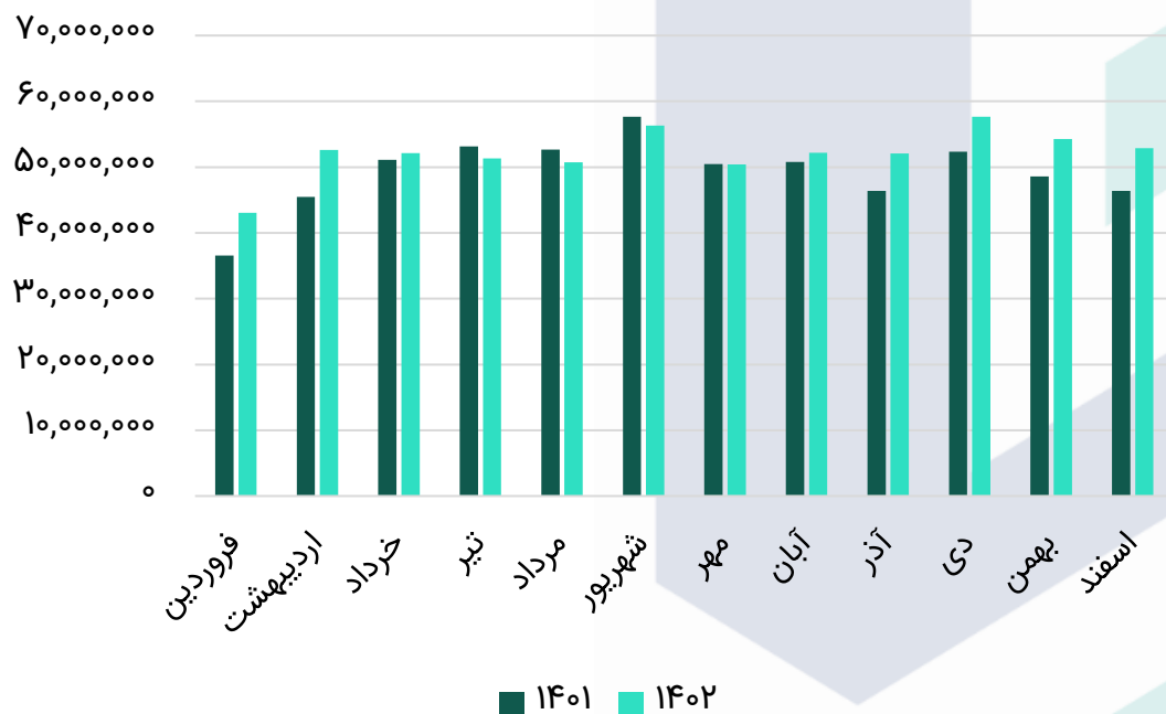
روند مقداری تولید (واحد)